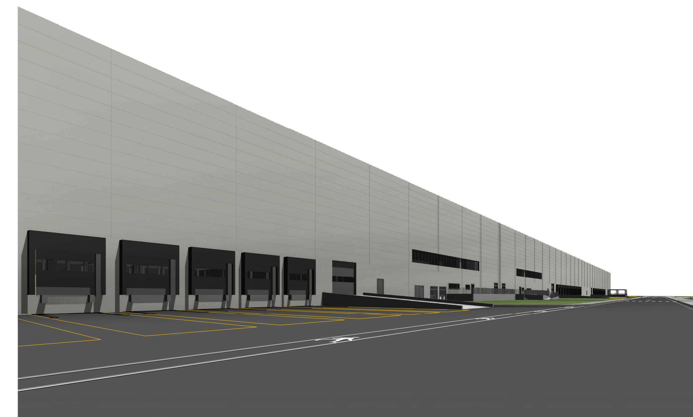
Vista prospettica lato Sud